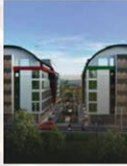
वाणिज्यिक कारोबार बिक्री के लिए कार्यालय (प्राइम जगह)