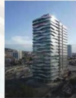
पारंपरिक वास्तुकला आधुनिक जीवन से मिलता है उत्तरी साइप्रस