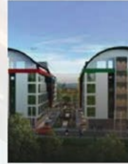
अपने सपने में जियो एजियन राजधानी में घर