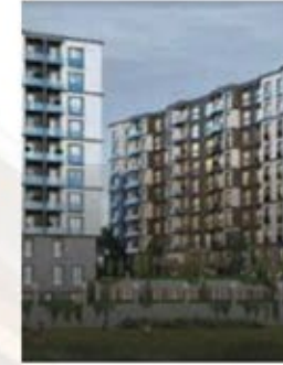
अदाहन 150 परियोजना