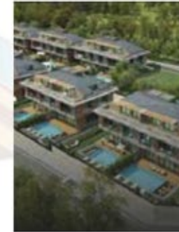
एक विला प्रोजेक्ट जो आपको उच्च- आरामदायक स्थान और शांति प्रदान करता है