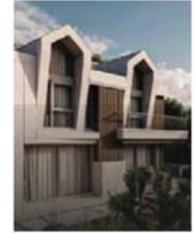
हलका पीला रंग विला