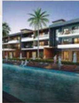
एक के लिए दरवाजे खोलो इज़मिर में शानदार जीवन