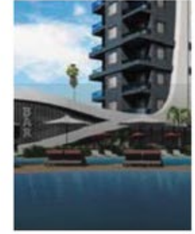
अद्भुत होटल संकल्पना अल्टियर निवास