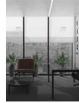
वाणिज्यिक कार्यालय में सिसली को विशिष्ट रूप से डिजाइन किया गया