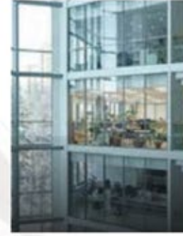
प्रीमियम व्यवसाय बिक्री के लिए कार्यालय