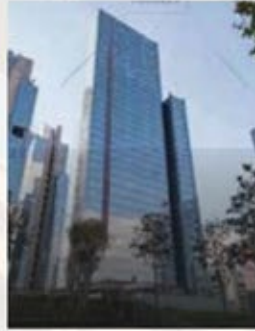
पूर्ण कार्यालय बिक्री के लिए उपलब्ध